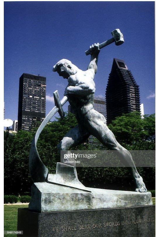
Das Denkmal wurde 1959 von der ehemaligen Sowjetunion der UN (New York) geschenkt.